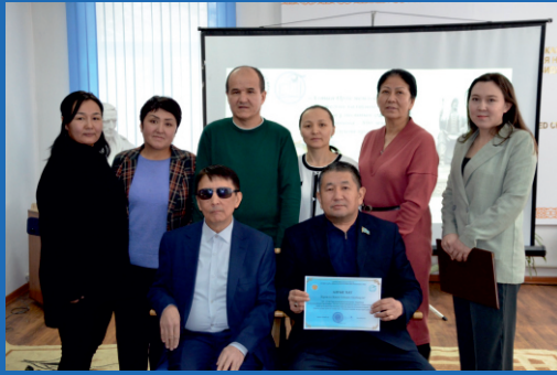
«Алтын Орда мемлекетінің негізін қалаушы» атты кездесу кешінен