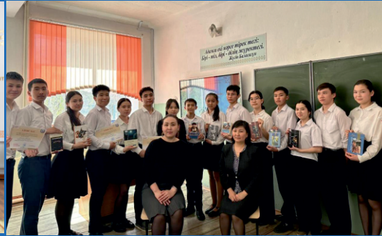
Мен білетін автор - интеллектуалдық ойын