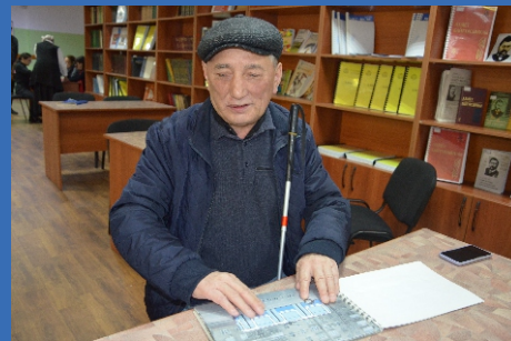
«Ақ таяқ» байқауы өткізілген сәтінен

Уважаемые читатели, вы можете стать авторами нашей газеты. Присылайте к нам свои статьи, очерки, стихи и прочие интересные материалы по адресу: 050000, г. Алматы, ул. Богенбай батыра, 214