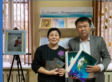
«Брайль қарпі - білімнің бастауы» атты тақырыптық әдеби кеш