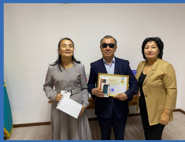
«Несломленная трость» жобасы аясында «Кітап менің өмірімде» оқырман бенефисі