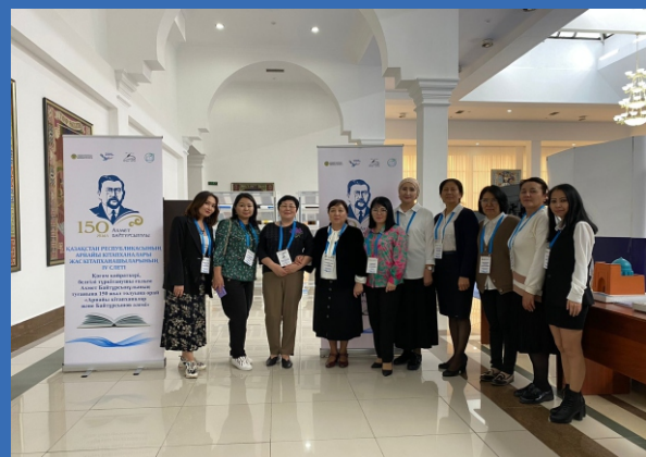
«Арнайы кітапханалар және Байтұрсынов әлемі» атты ҚР Арнайы кітапханалары Жас кітапханашыларының IV Слөті

Уважаемые читатели, вы можете стать авторами нашей газеты.